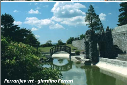
Ferrarijev vrt - giardino Ferrari