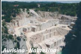
Aurisina - Nabrežina