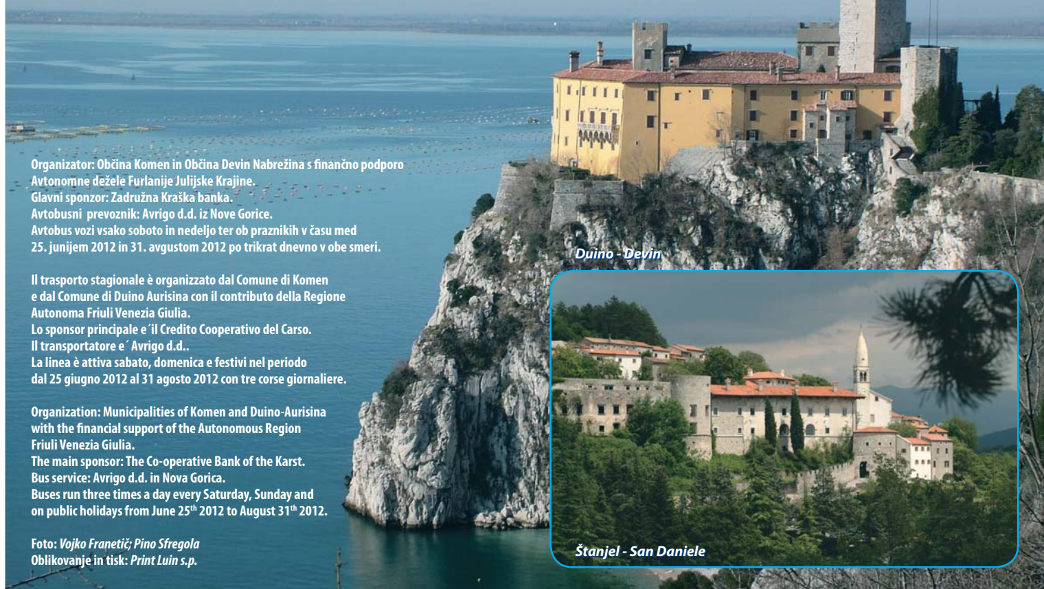
Duino - Devin

(Štanjel - Baia di Sistiana/ Sesljanski zaliv - Duino/Devin)