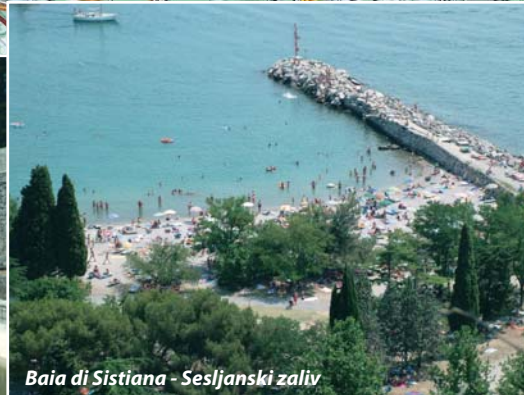
Baia di Sistiana - Sesljanski zaliv